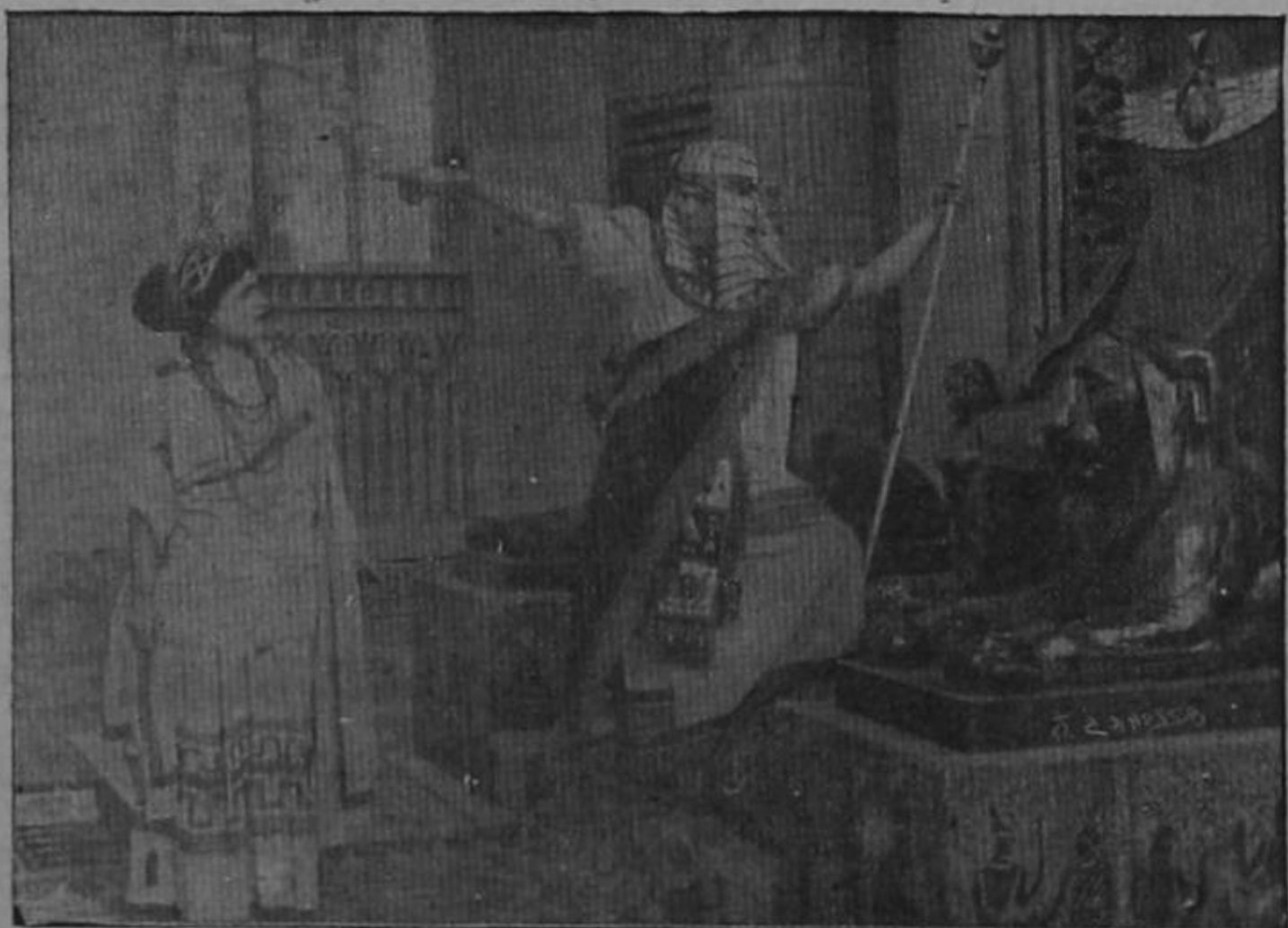
Grandiosa cinta cinematográfica. Próximamente en esta capital.